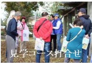
見学コース打合せ

【見学コース】 壬生城址公園→精忠神社→壬生寺→常楽寺→興光寺→石崎邸→大手門→藩校学習館跡→壬生城址公園まで約2時間30分です。