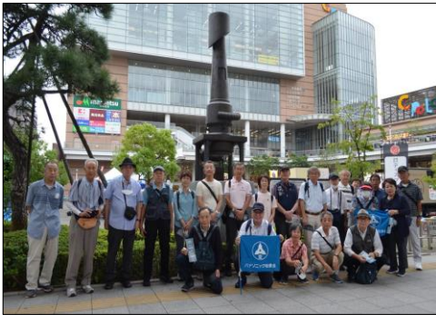
JR川口駅 キューポラ のモニュメン ト前にて

9月30日、曇り空の下23名が参加しました。「キューポラ」は鑄物づくりの溶解炉のこと(下の写真の背景)。往年の名作映画を思い浮かべる方も多いでしょう。今も盛んな鑄物工場と、江戸と日光を結び将軍も通った街道の宿場町として栄えた川口の様々な旧跡を訪ねました。最近では東京のベッドタウンとして子育て世代に人気の街ですが、古い歴史とモノづくりを支える活力を感じた一日でした。