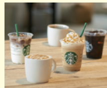
スターバックス ドリンクチケット500円分