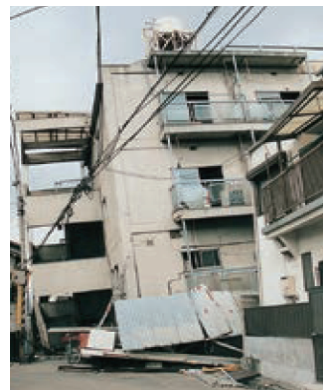
データ出典:防災科学技術研究所、総務省消防庁