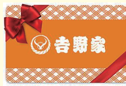
吉野家 500円ギフト券