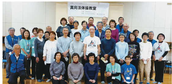
体操終了後、爽快感にあふれた参加者の健康笑顔