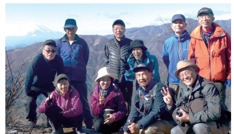
冠雪の富士山を背に「山酔会」のみなさん