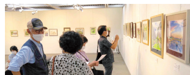
秋の展覧会「松愛展」で成果披露