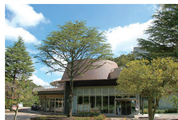
圧倒的にリアルな星空で感動!