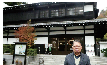
各地の古民家が集結「日本民家園」