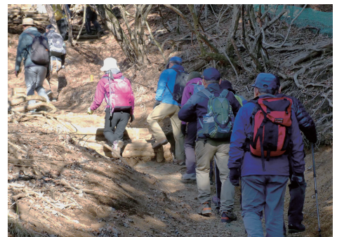
1月の丹沢・大山 阿夫利神社初詣の登り