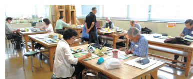
例会で真剣に取り組む会員のみなさん

携帯電話: 090-2310-1809 メールアドレス: yoshihaya@k08.itscom.net