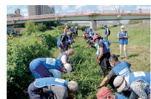
昨年秋の活動風景