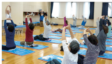
硬い体をしっかり伸ばします