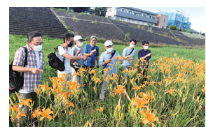
野萱草の開花カウント