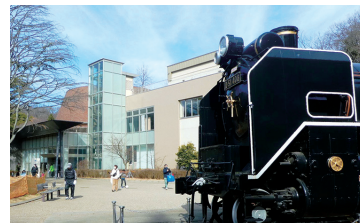
子供たちに大人気、懐かしのSL