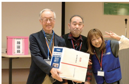
最大盛り上がり、恒例の大抽選会