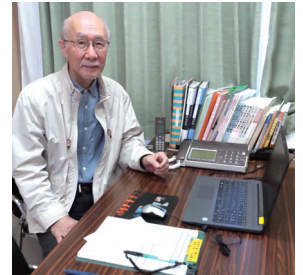
相談事への対応や広報誌の編集作業