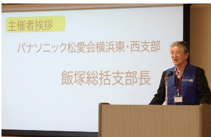
飯塚総括支部長の挨拶からスタート