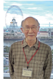
研修会会場の桜木町にて

*「横浜ラポールのピア相談室」を検索いただくと、横浜市の詳細支援活動の内容をご覧いただけます。