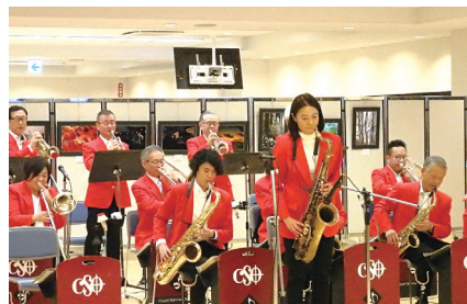
カウント・セイノウ・オーケストラの熱演